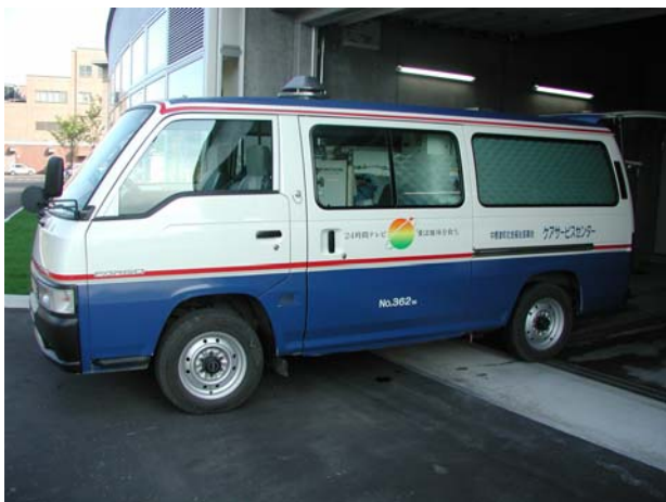
→この入浴車で自宅を訪問します

居宅介護支援事業は、在宅の要介護者等が介護保険の在宅サービスやその他のサービス等を適切に利用できるように、要介護者等の依頼により行われる居宅サービス計画の作成、サービス事業者との連絡調整や、介護保険施設への紹介等を行います。